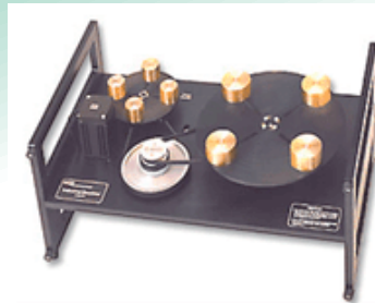
二慣性共振システム