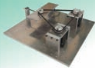
張力・速度制御装置

産学連携が可能な研究テーマ: ロバスト制御手法の産業応用(主に、メカトロニクスシステム)、モデル化困難な対象に対するデータ駆動型制御器設計、制御パラメータのオンライン・オンサイトチューニング手法など。