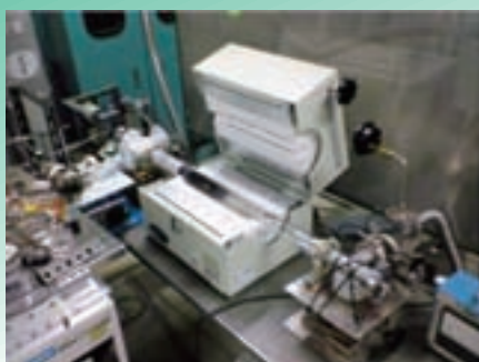
熱CVD装置 (カーボンナノチューブ成長装置)

産学連携が可能な研究テーマ: ナノカーボン材料の生成に関する研究、カーボンナノチューブ紡績、カーボンナノチューブケーブル製作、カーボンナノチューブの電子源作製と評価、カーボンナノチューブの各種応用(センサ製作、SPM探針製作)、各種機能性薄膜作製とその評価、真空技術に関連する研究一般