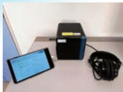
音(映像を含む)の官能評価をインターネットを利用して遠隔地でも実施できるようにした実験システムです。