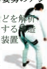
作業姿勢アシスト装置

人の筋肉疲労や椎間板にかかる力などを解析 弾性材や機械的機構によりアシストする構造 軽量かつ装着性にも優れたアシスト装置