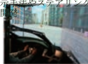
ドライビングシミュレータ