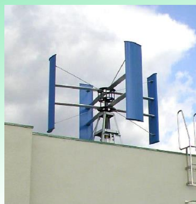
小型風力発電システム