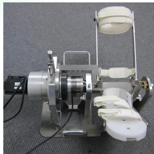
足関節の運動機能評価