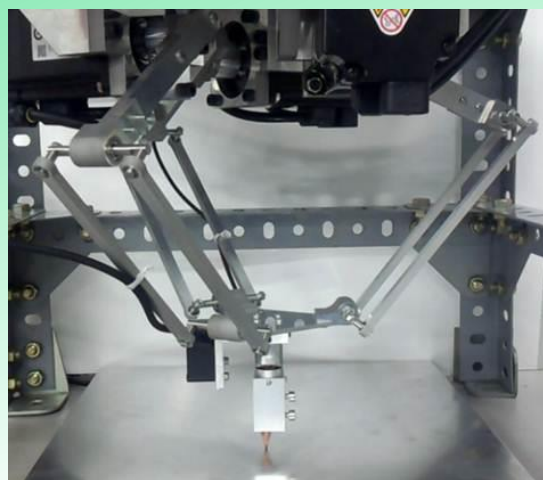
倣い動作の 教示と自動再生

NC工作機械・ステージ装置・エレベータ・ディスク装置・車両駆動システム・圧延機・印刷機・フィルム成形機・協働ロボット・運動支援装置・電動航空機などの高精度制御。