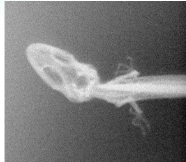
液体Li電子源を搭載したX線顕微鏡の観察例(ヤモリ、露光時間1秒)