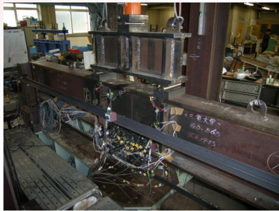
鉄骨構造高力ボルト接合部の実験