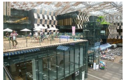
研究2: 人と人をつなぐ場のイメージ