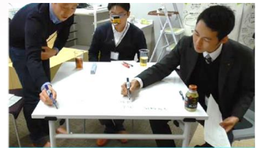
研究3: 参加者行動の実験