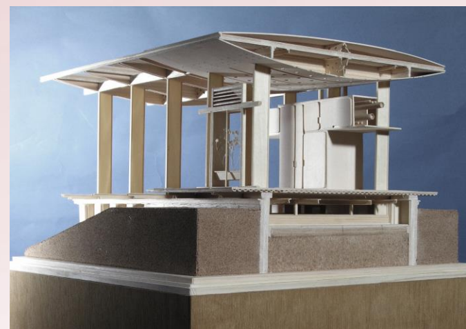
薄鋼板を用いた建築プロトタイプ的设计