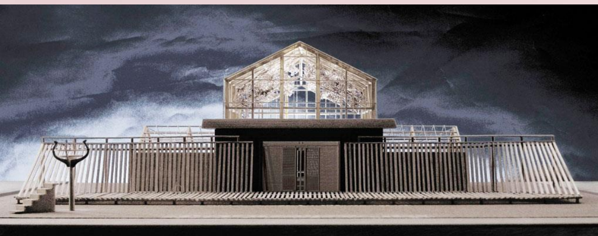
三重大学高野尾キャンパス熱帯植物温室再生計画