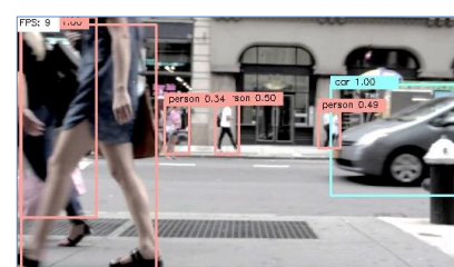
Deep Learning による移動物体の自動検出・追跡