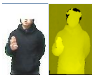
手話・指文字の認識