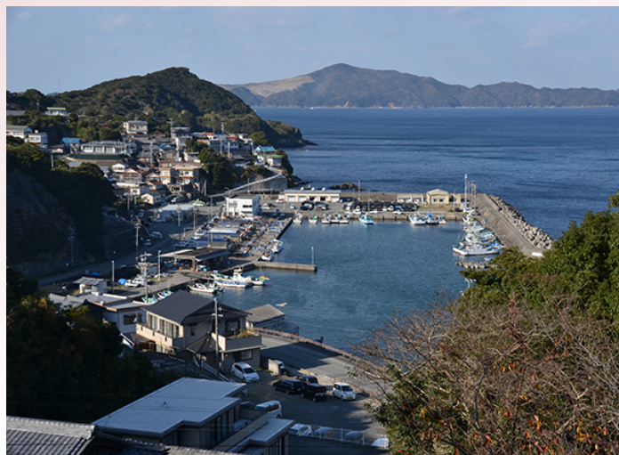
漁村集落の景観調査の例(鳥羽市)