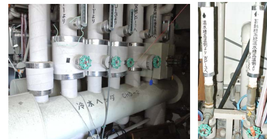
実験用蓄熱式空調システム